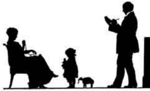
Георгий Нарбут. Автопортрет с семьей.

В семнадцатом, восемнадцатом и девятнадцатом веках в качестве дешевого и быстрого изображения портрета стали популярны силуэты. Зачастую создаваемые любителями, в основном женщинами, они являются сентиментальной реликвией викторианской эпохи, милыми сувенирами с нарисованными неизвестными людьми из прошлого, застывшими в чернилах, красках, вырезанными из бумаги или отображенными на фарфоре.