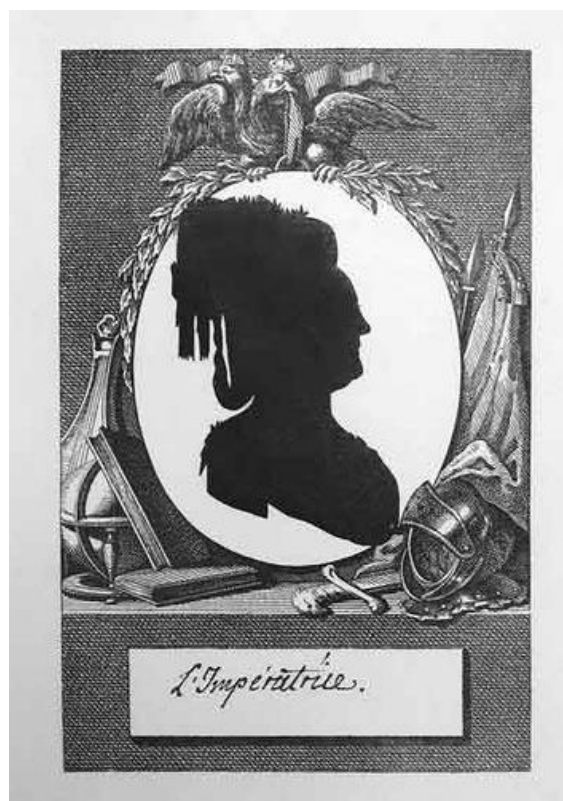
Ф. Сидо. Портрет князя Г. А. Потемкина и портрет самой Императрицы

Вторая половина XVIII в. Из книги "Двор императрицы Екатерины II и ее приближенные". СПб., 1899