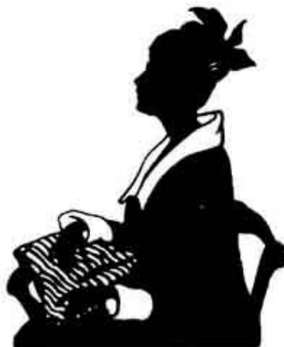
Елизавета Кругликова. Силуэт Ирины Одоевцевой.